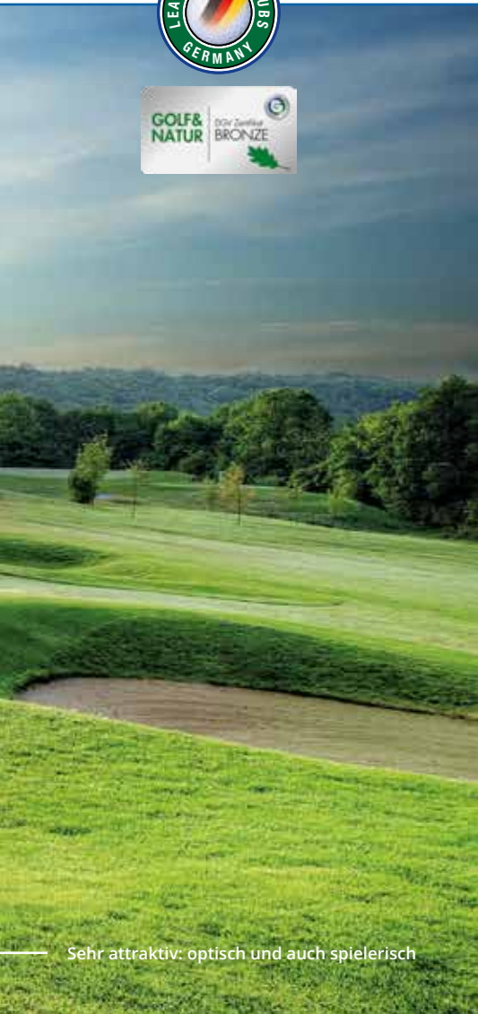
Sehr attraktiv: optisch und auch spielerisch

tiert. Plötzlich ändert sich das Bild erneut und der Spieler wähnt sich auf einer Anlage, die auch im Herzen Floridas residieren könnte, wo breite Fairways und zahlreiche Bunker beliebt sind. Und irgendwann kommt man sogar am Strand an!